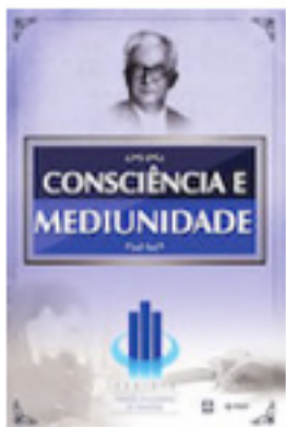
Consciência e Mediunidade Manoel Philomeno de Miranda de CHF 20.- por CHF 16.-

Visite a nossa página www.geepe.ch/livraria e confira a lista de livros e dvd's à venda e centenas de livros para aluguel!